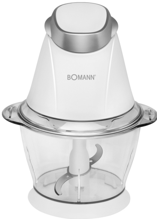
MZ 449 MULTI MIXER